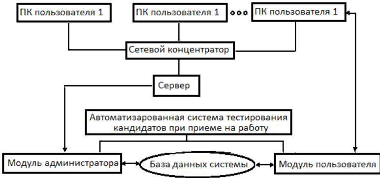
Рисунок 3: Структурная схема «Автоматизированная система тестирования кандидатов при приеме на работу»

Анализ и проверка результатов контрольных также проводится автоматизированным путем. По результатам контроля можно получить автоматически сформулированный итоговый протокол, соответствующий по структуре желанию работодателя.